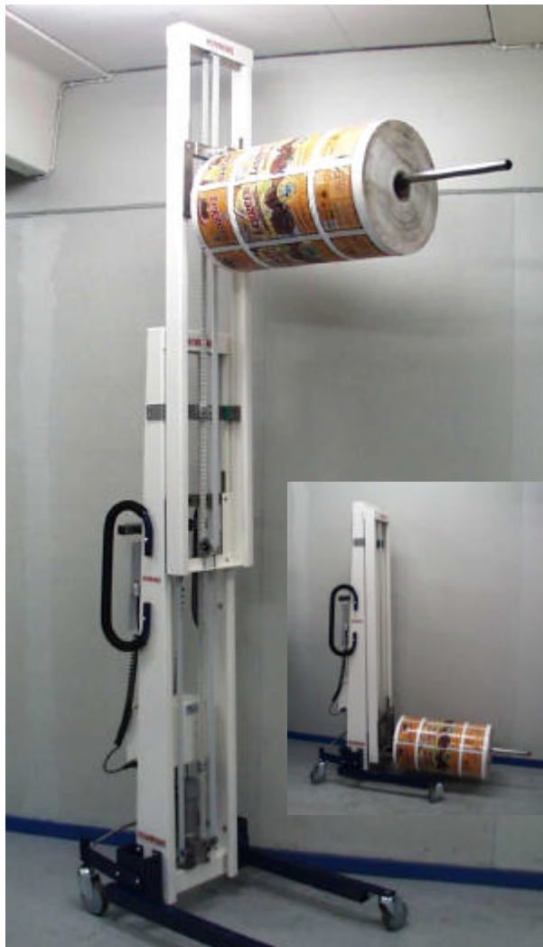
Teleskoplift Typ E90T- 1960, Hubhöhe 2800mm